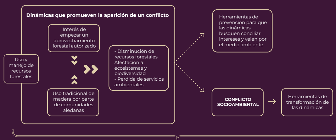
Diagrama que expone el contenido del programa a través de un ejemplo

Análisis y aplicación continua a través de comunidad de aprendizaje y práctica, apoyados de herramientas de investigación y comunicación para elaborar el trabajo de titulación