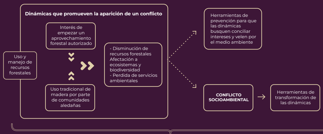
Diagrama que expone el contenido del programa a través de un ejemplo

Análisis y aplicación continua a través de comunidad de aprendizaje y práctica, apoyados de herramientas de investigación y comunicación para elaborar el trabajo de titulación