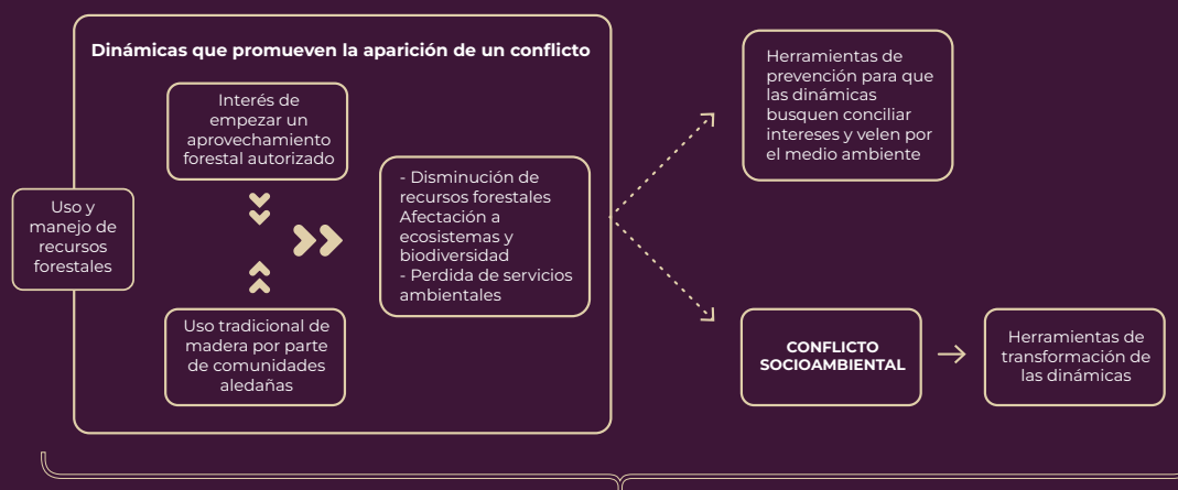
Diagrama que expone el contenido del programa a través de un ejemplo

Análisis y aplicación continua a través de comunidad de aprendizaje y práctica, apoyados de herramientas de investigación y comunicación para elaborar el trabajo de titulación